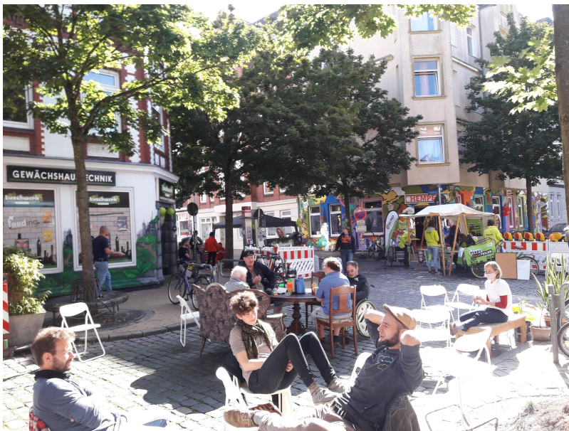
Kieler Parklettag 2020, Menschen bevölkern die Straße (c) Thilo Pfennig, Lizenz: gemeinfrei

2020 fand bereits ein ähnliches Format statt, mit dem Kieler Parklettag: